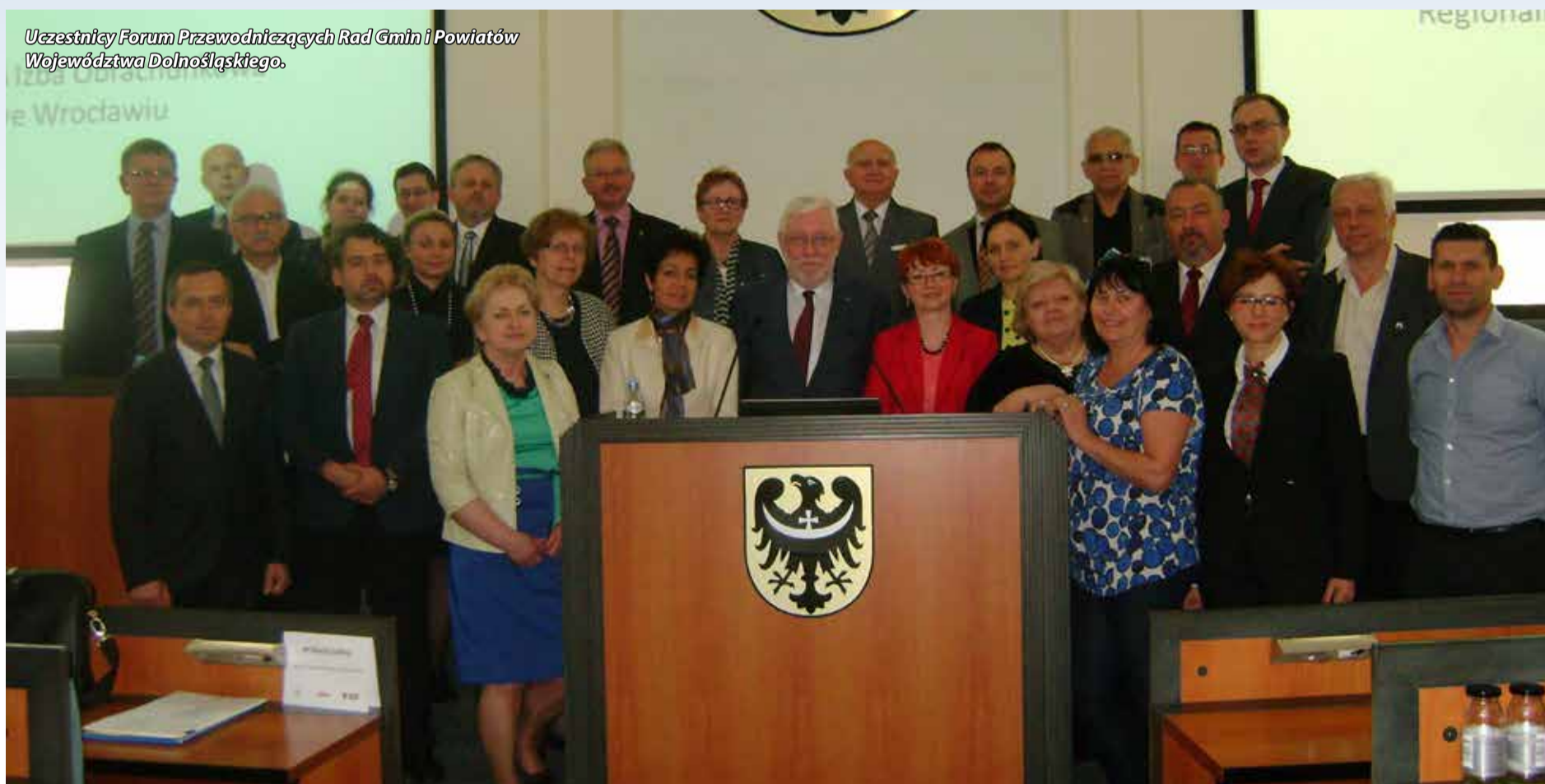
Uczestnicy Forum Przewodniczących Rad Gmin i Powiatów Województwa Dolnośląskiego.

bliższym otoczeniu i, co warto podkreślić, mogą w nim sporo zmienić na lepsze. Transformacja systemowa w 1989 roku w Polsce spowodowała zmianę systemu władzy samorządowej. W 1990 roku przeprowadzona została reforma gmin, a w 1998 utworzono powiaty. Uległ też zmianie podział administracyjny kraju. W 1999 roku zostały wprowadzone trzy szczeble samorządu terytorialnego: gmina, powiat i samorząd województwa. Każdy z nich posiada inną strukturę i odmienne kompetencje. Jednak cały system samorządów nie ma charakteru hierarchicznego, czyli działania samorządu wojewódzkiego nie naruszają kompetencji samorządu powiatowego czy też gminnego. Samorząd nie jest zależny od jednostek rządowej administracji i posiada osobowość prawną oraz prawo do dys-