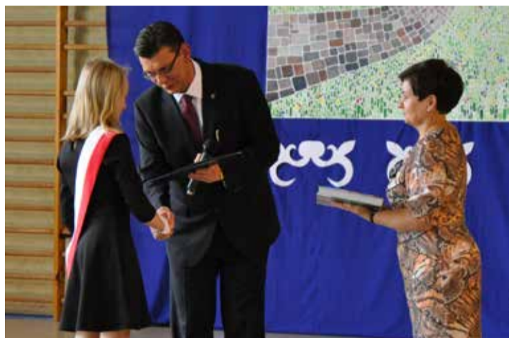
Fot. UMIG Bogatynia