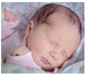
Flora Kotowicz 24 maja 2015