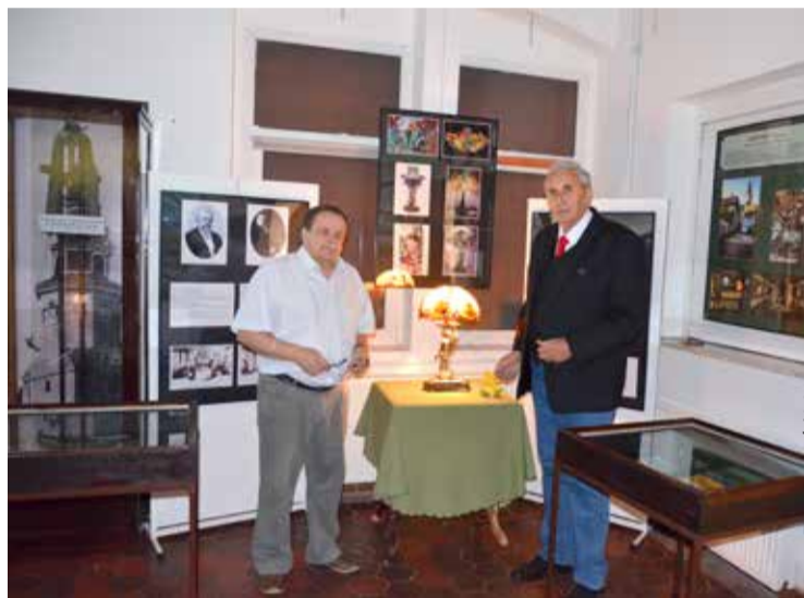
Bractwo Ziemi Bogatyńskiej

stawy szczególną uwagę zwrócili na technikę wykonania, okres pochodzenia oraz twórców i warsztaty, w których powstawały witraże. Okres przygotowań materiałów do wystawy trwał około trzech lat, podczas których członkowie Bractwa wspólnie z niemieckimi specjalistami oraz miejskim muzeum w Zittau dotarli do interesujących informacji o witrażach. Do najbardziej znanych pracowni i twórców witraży w Bogatyni i okolicy należy zaliczyć C.L.Türcke & CO oraz Kunstwerkstatt Richarda