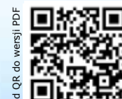
Kod QR do wersji PDF