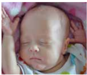
Liliana Ciunel 28 marca 2015